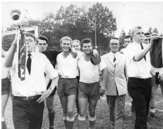
Nach Spielschluss: Mitglieder des Fanfarenzuges „Rote Heide“ sowie Bürgermeister B. Zurlienen und Spieler

acht Tage vor dem Finale, dass Fürstenau ihr Gegner sein würde. Damit hatte man einen Kontrahenten, der aufgrund seiner Stärke gehörig Respekt einflößte und dem die Rolle des Favoriten zugesprochen wurde. Es kam zu Gehör, dass die „Stadväter“ von Fürstenau bereits einen feierlichen Empfang des vermeintlichen Siegers im Rathaus vorbereitet hatten. In Bersenbrück – so wurde verraten – hatte man an so etwas nicht gedacht. Regel-