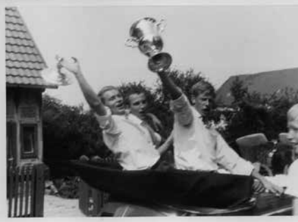
Per Cabrio im Schützenumzug