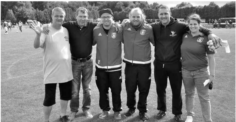
Halbzeiteinlage TuS Bersenbrück gegen Arminia Hannover.